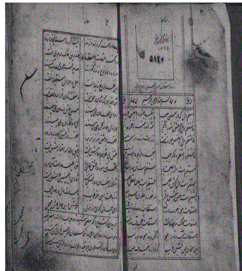
صفحه نخستین نسخه خطی ۱۱۳۲